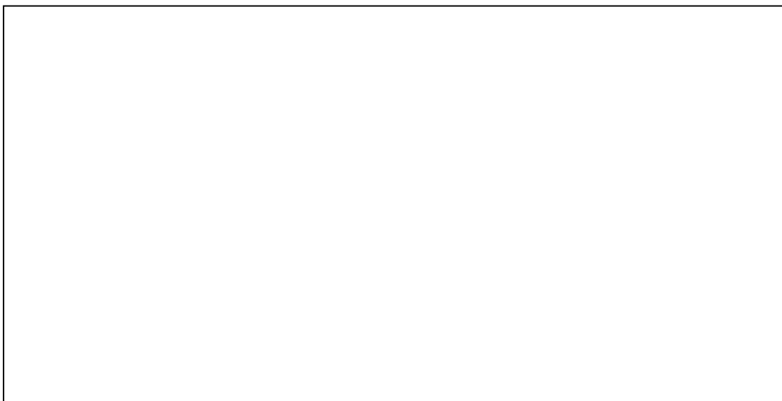
Gambar 2. Jika tidak cukup dengan pengaturan dua kolom, gambar diatur untuk 1 kolom seperti penulisan judul dan abstrak.

Disarankan untuk meletakkan Gambar 2 dan Tabel 2 pada halaman yang sama dengan penjelasan teksnya. Jika tidak cukup dalam satu kolom, tabel dapat diletakkan untuk 2 kolom. Hal yang sama jika gambar tidak cukup dengan pengaturan dua kolom, maka diatur untuk 1 kolom seperti format penulisan judul dan abstrak.